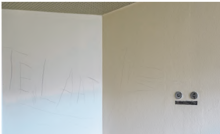
Muur van de isoleercel.