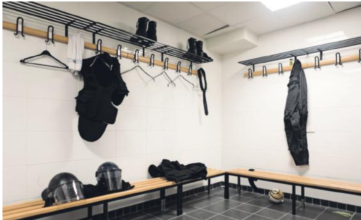
Omkleedruimte van het interne bijstandsteam.