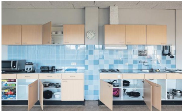
Keuken in een van de woongroepen.